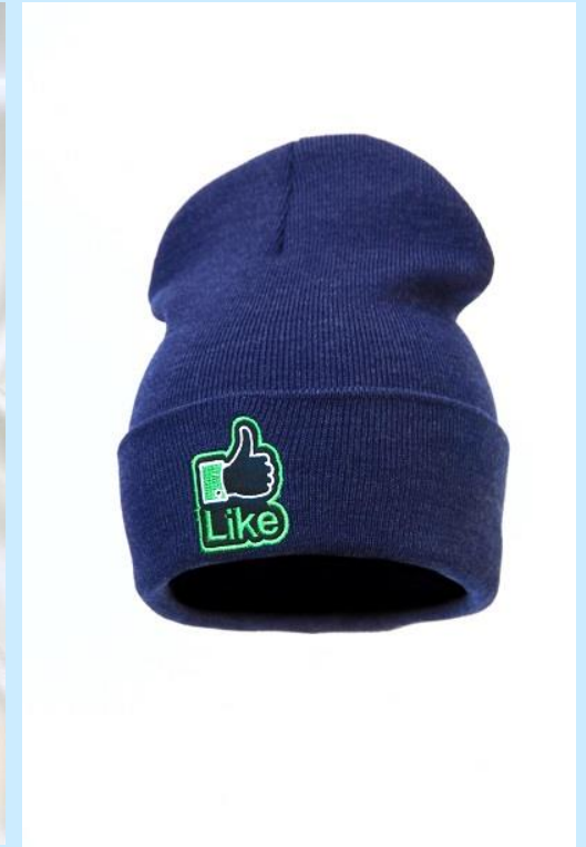
double hat 100% acrylic, price 3$