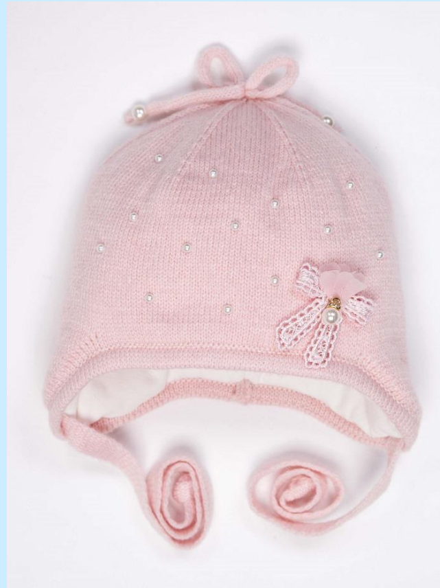
Children's hat with cotton lining, price 3,7$