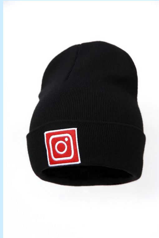
double hat 100% acrylic, price 3$