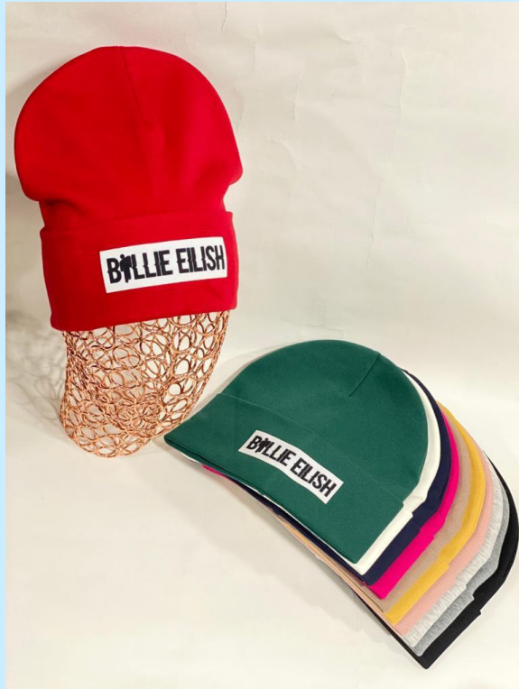
double hat 100% cotton, price 3$