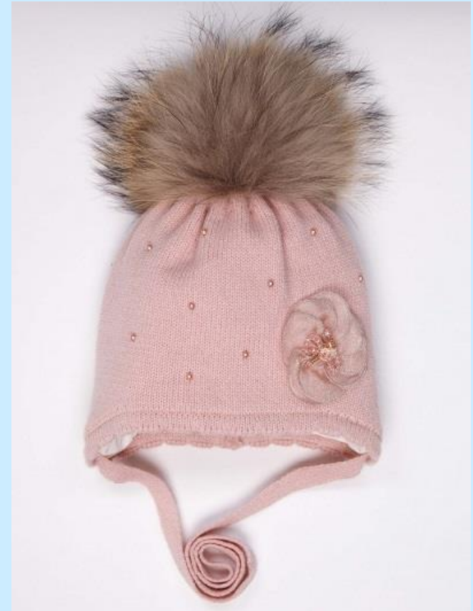
Children's hat with a natural pompom, price 8$