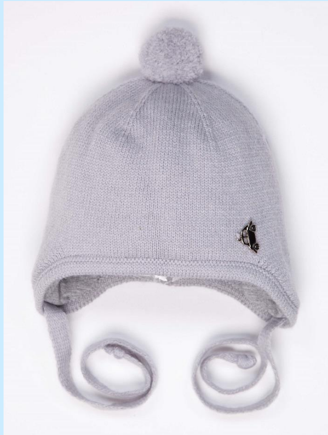
Children's hat with cotton lining, price 3,5$