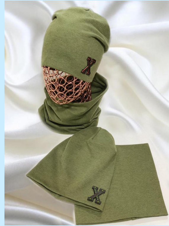
double hat and scarf 100% cotton, price 5$